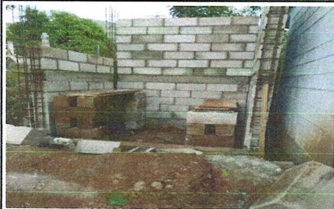
Foto 3: Inicio del trabajo de reparación y sustitución de pila y deposito de agua